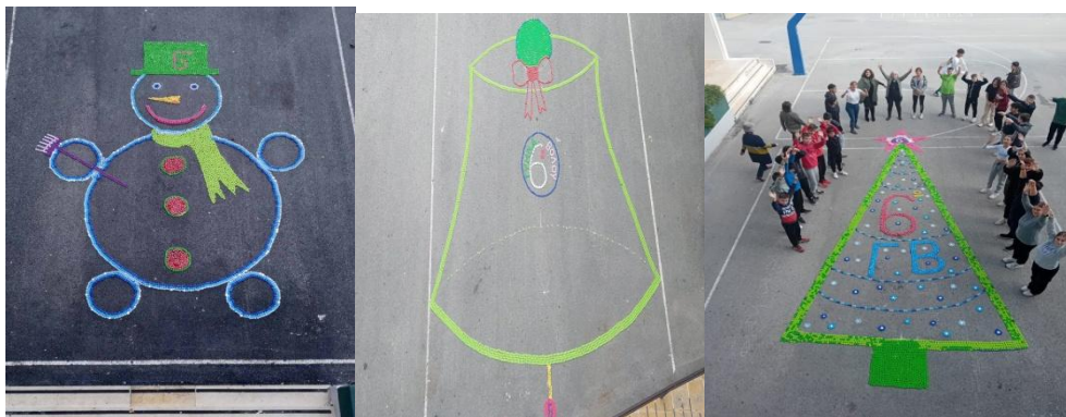
Εικόνα 5: Έργα από πλαστικά καπάκια που δημιουργήσαμε μαζί με τους μαθητές/τριες στην αυλή του σχολείου τον Δεκέμβριο του 2023