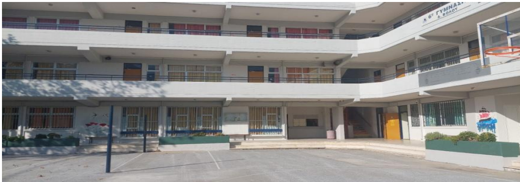
Εικόνα 3: Η πρόσοψη του σχολείου