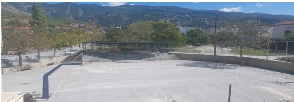
Εικόνα 4: Το θεατράκι στην αυλή του σχολείου