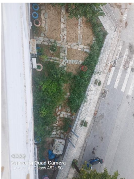
Εικόνα 8: Ο κήπος από την ταράτσα του σχολείου όπως διαμορφώθηκε το 2024